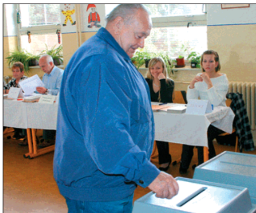
První pudlovský občan ve volební místnosti.