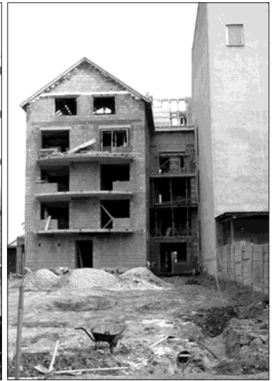
Dva pohledy na novostavbu ve Starém Bohumíně, která je již pod střechou - ze strany náměstí a z vnitrobloku.