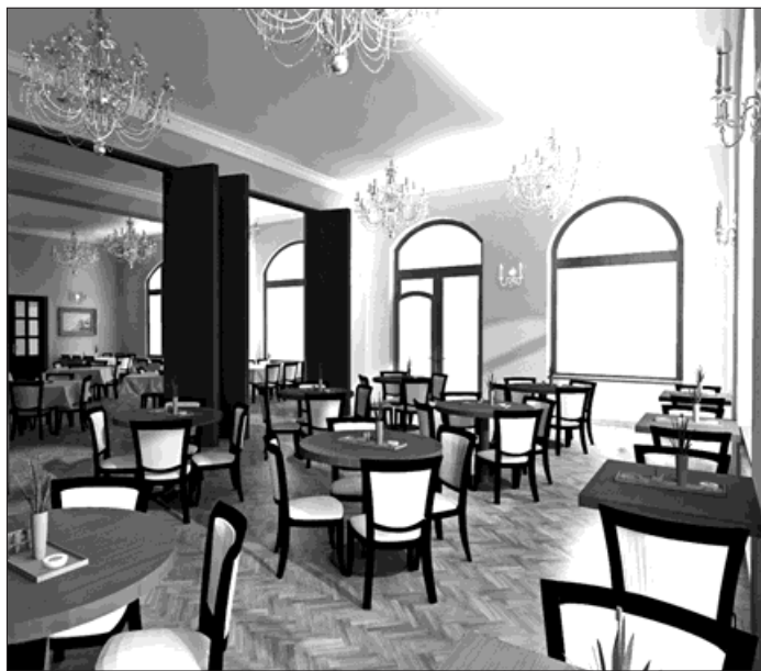
Vizualizace interiéru kavárny Národního domu, která by po rekonstrukci mohla právě takhle vypadat.

Po rekonstrukci se stane Národní dům především centrem kultury, a to nejen Starého Bohumína, ale celého města. Jeho velký sál bude vítanou alternativou kina K3 při konání koncertů nebo divadelních představení. Hotelovou část by mohla řídit městská společnost Bospor, která má zkušenosti s provozováním Penzionu ve věži. Na provoz restaurace a fit centra vypíše město výběrové řízení.